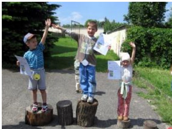
Poslední májový den se v naší školce

Ve čtvrtek, 10. května se uskutečnila ve školce besídka pro maminky k jejich svátku, kde děti přednesly a zazpívaly svým maminkám pěkné básničky, písničky a předaly jim dárečky, které si pro ně připravily v mateřské škole. Zábavné odpoledne pro maminky připravili i naši školáci.